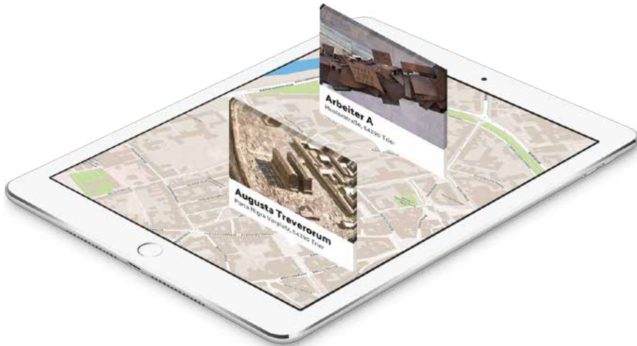
Abbildung: Europäische Kunstakademie

„public-art-trier“ oder was Hochschule und Universität gemeinsam können